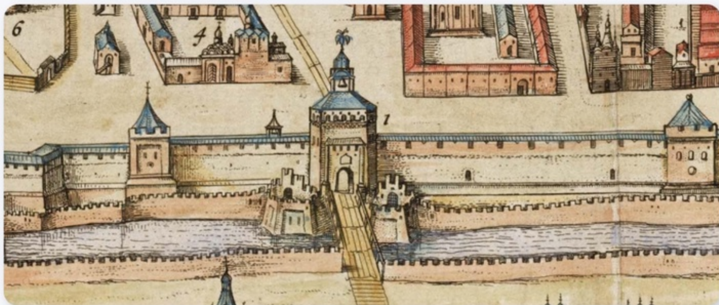
Фото: план Москвы начала XVII века (впервые опубликован картографом Г. Гесселем в 1613 году)