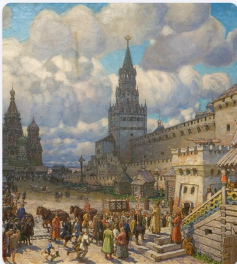
Фрагмент картины: Красная площадь во второй половине XVII века, Васнецов А. М. 1925 год

Как и произведение Галовея, часы сгорели при пожаре — в 1737 году .