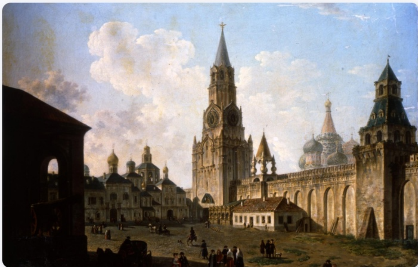
Картина: Вид в Кремле у Спасской башни (на Вознесенский монастырь). Алексеев Ф. Я. 1800-е гг. Государственный исторический музей

Почти четыре года куранты ремонтировал немецкий часовой мастер Фаций . Он же настроил на них мелодию «Ах, мой милый Августин», популярную в то время в Германии. Но вскоре власти велели её убрать.