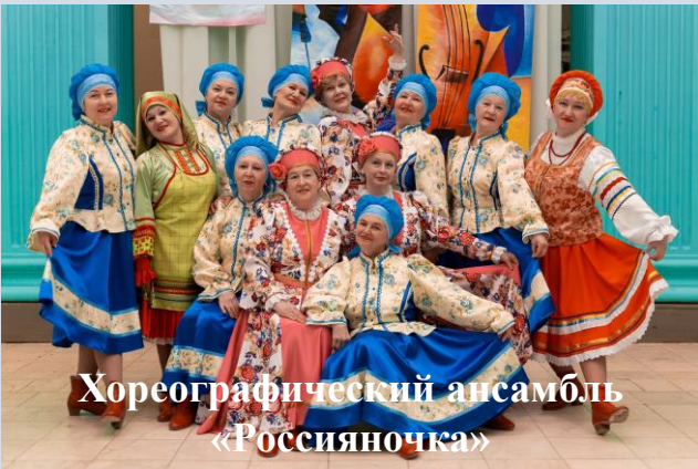
Хореографический ансамбль «Россияночка»