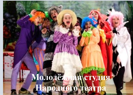
Молодёжная студия Народного театра