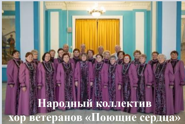
Народный коллектив хор ветеранов «Поющие сердца»