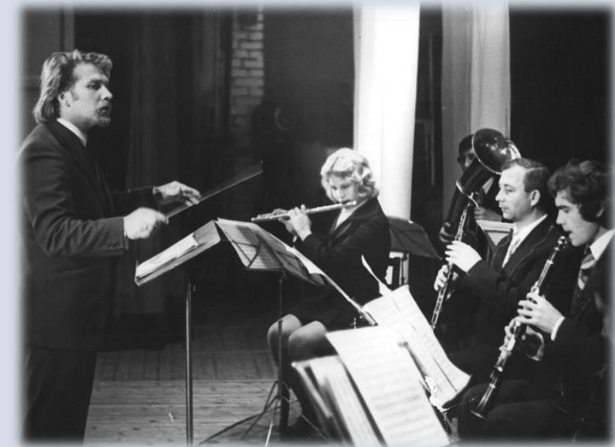
Основание: Ф. Р-212. Оп.1Ф. Д. 1136, 1187, Д. 1395.