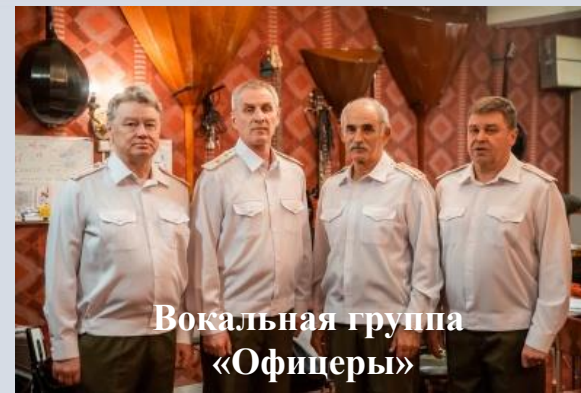
Вокальная группа «Офицеры»