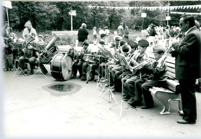
«Парк ожил» - аттракцион «Грибок». Выступает духовой оркестр школы-интерната № 2.