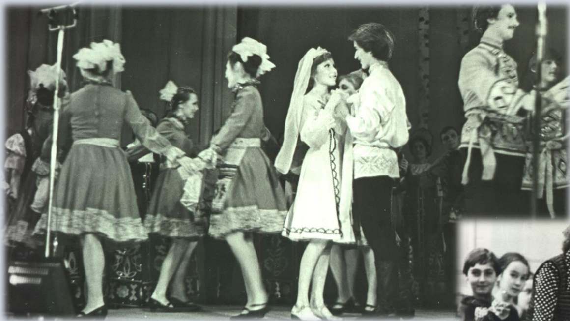
Выступление танцоров ДК «Россия» на смотре художественных коллективов города. Снимок 23.02.1980 г.