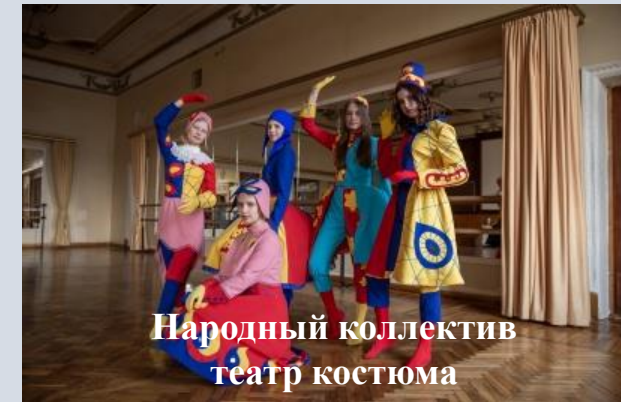
Народный коллектив театр костюма