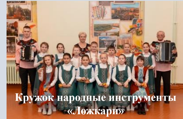
Кружок народные инструменты «Ложкари»