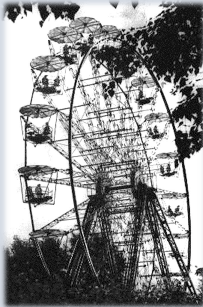
Новый аттракцион (колесо обозрения) в парке культуры и отдыха.

В ведение Дома культуры с 1952 г. вошла киноустановка «Родина», и с 1953 - Парк культуры и отдыха.