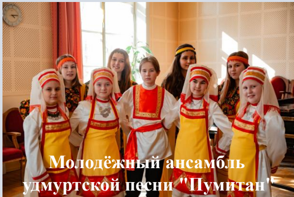
Молодёжный ансамбль удмуртской песни «Пумитан»