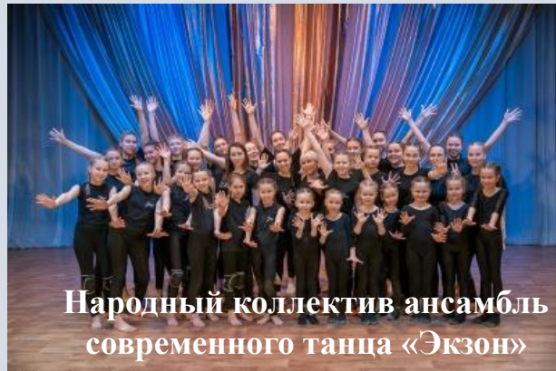
Народный коллектив ансамбль современного танца «Экзон»