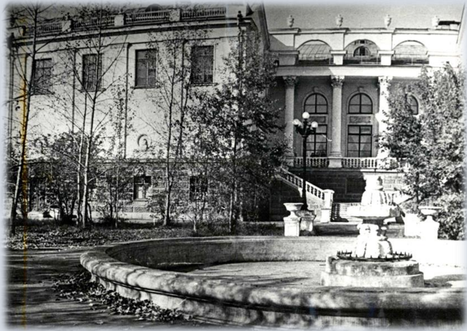
Здание дворца культуры "Россия". Вид со двора.