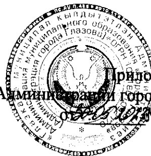
ГРАФИК заседаний комиссии по обеспечению своевременной подготовки и устойчивого проведения отопительного периода 2023 – 2024 годов в муниципальном образовании «Город Глазов»

Приложение № 5 к постановлению Администрации города Глазова