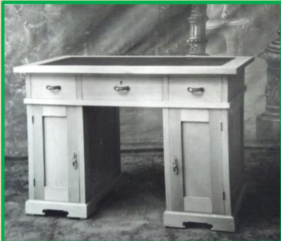
Стол письменный двухтумбовый, хвойный, с тремя в подстолье ящиками, двумя дверками и по одной полке в каждой тумбе

Министерство Лесной Промышленности Удмуртской АССР