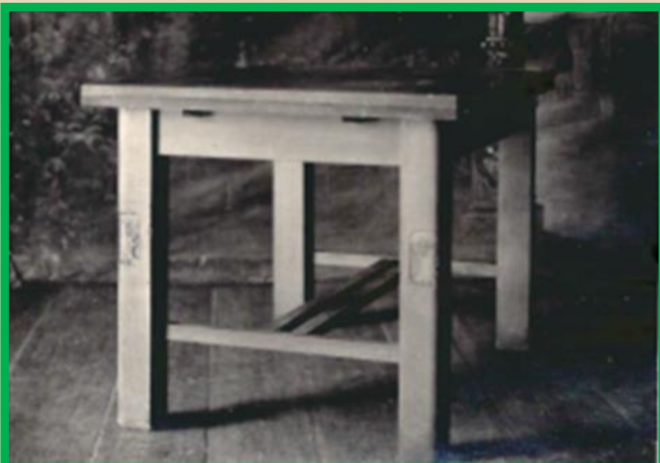
Стол обеденный раздвижной, на простых ножках с двумя выдвигаемыми полу крышками