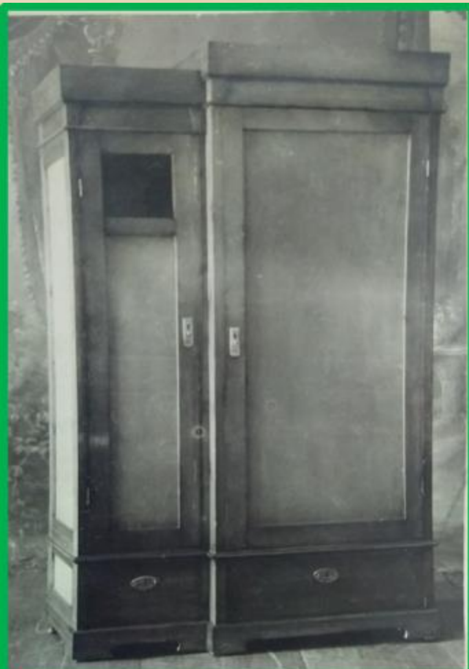
Шкаф для платья и белья, хвойный с левым бельевым отделением и выступающим гардеробом с 2 дверками и с 2 наружными ящиками