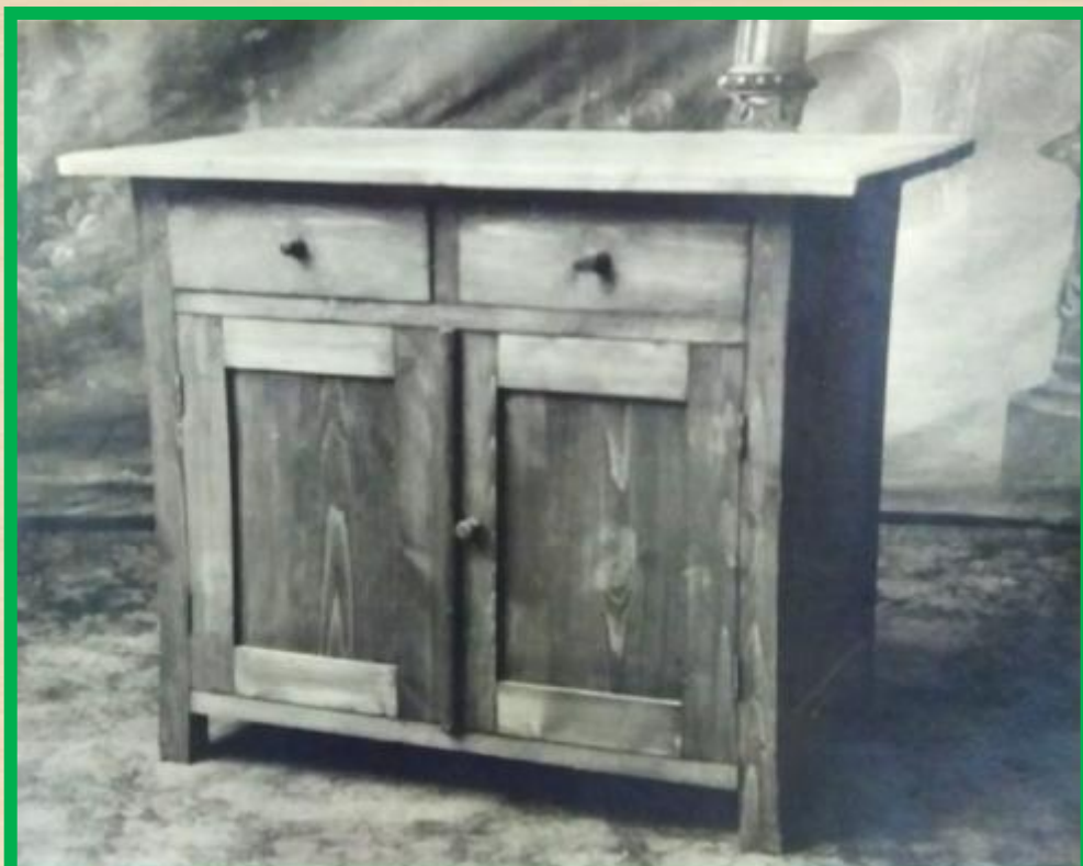
Стол хвойный кухонный с двухстворчатым шкафчиком и с двумя верхними ящиками, рамочной конструкции