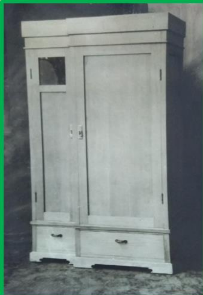
Шкаф для платья и белья, хвойный с левым бельевым отделением и выступающим гардеробом, с 2 дверками и 2 наружными ящиками