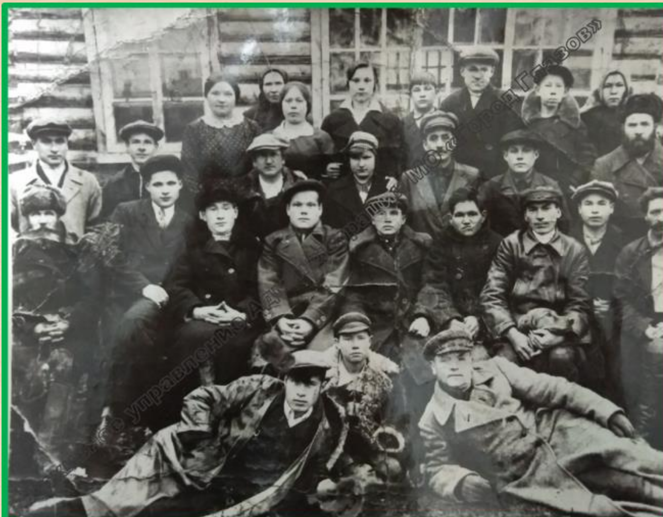
Коллектив работников Глазовской мебельной фабрики. 1936 г.

Глазовская мебельная фабрика была образована 5 марта 1934 года на основании решения бюро Глазовского райкома ВКП (б). Она располагалась по адресу: г. Глазов, ул. Оханская (ныне ул. Будённого), д. 28. Тогда же был утвержден ассортимент производства мебели – буфеты, шкафы, кушетки, столы, стулья, табуретки, комоды, сундуки – и был начат выпуск первой продукции. За первый год своего существования фабрика выпустила продукции на 2,1 тысячи рублей с числом работающих 29 человек.