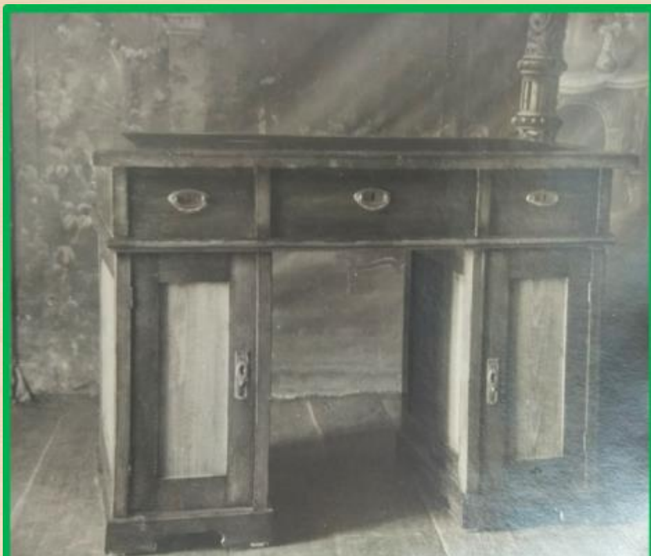
Стол письменный двухтумбовый хвойный. Подстолье съемное с тремя ящиками

Министерство Лесной Промышленности Удмуртской АССР