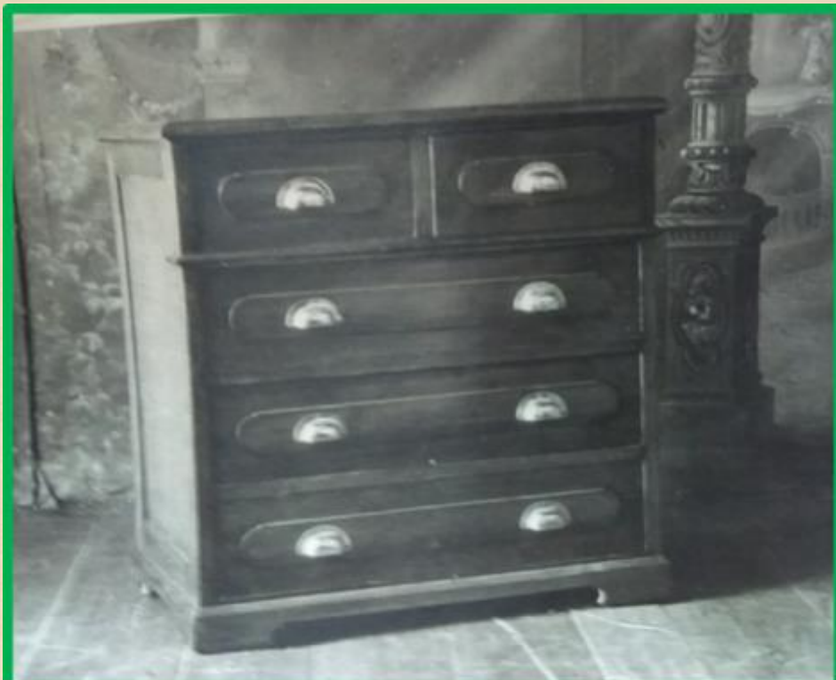
Комод хвойный с наружными 2 малыми и 3 большими ящиками по краям с фасонным штапом, неразборный, рамочной конструкции