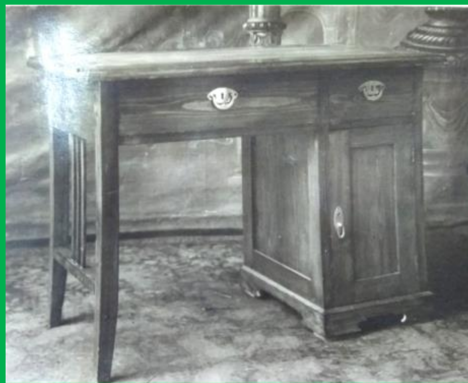
Стол хвойный письменный однотумбовый с двумя квадратными ножками. Тумба с дверкой и внутренней полкой, в подстолье ящик.