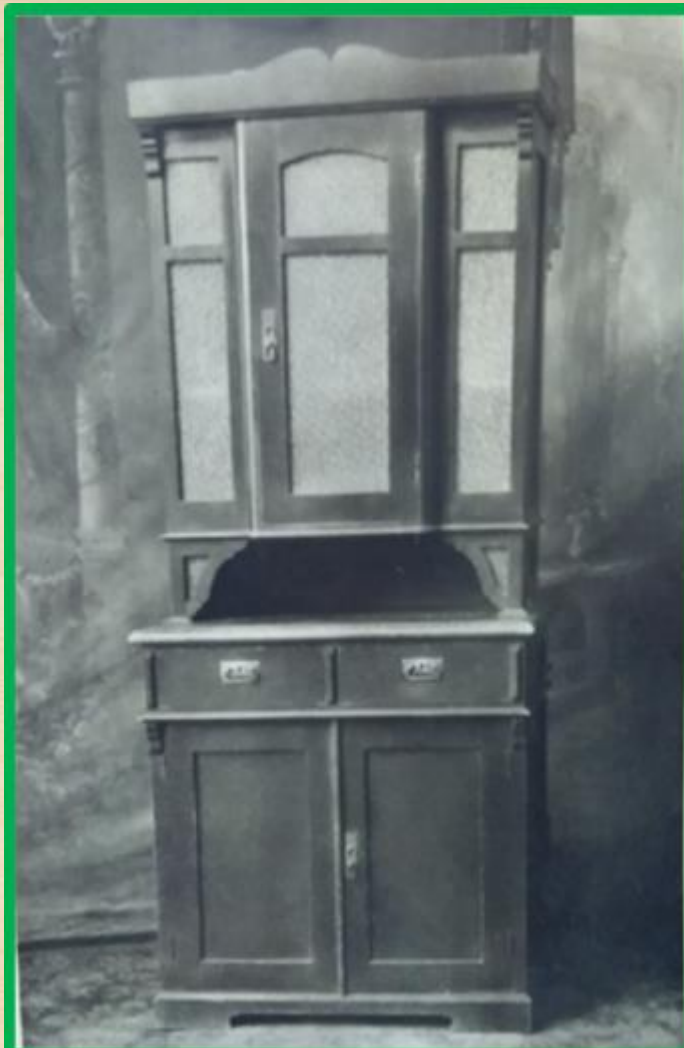
Буфет хвойный составной из тумбы и верхнего шкафчика