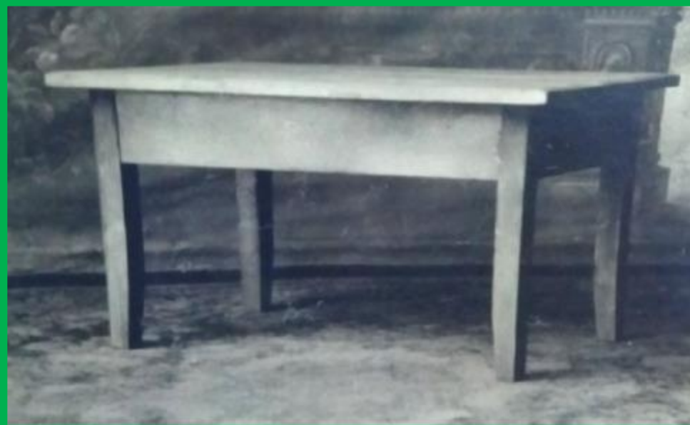
Стол детский хвойный на квадратных ножках, крышка щитовой конструкции