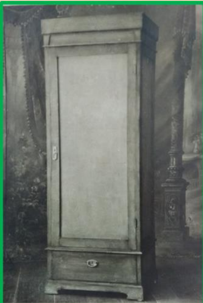
Шкаф для платья, хвойный с одной дверкой и наружным ящиком, неразборной, рамочной конструкции