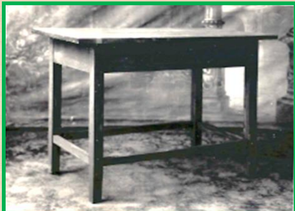
Стол гражданский, на прямоугольных ножках. с одним ящиком, с проножками