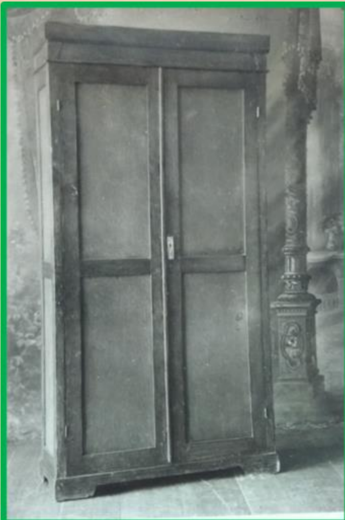
Шкаф книжный хвойный с 2 дверками, 4 полками, неразборный, рамочный конструкции