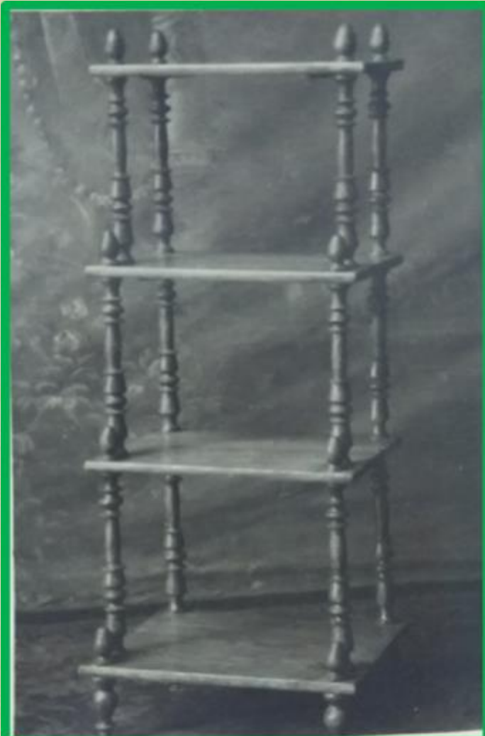
Этажерка хвойная с 4 полками убывающими по глубине на точенных фигурных колонках