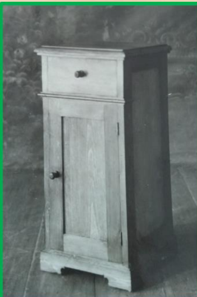
Тумбочка с 1 наружным ящиком и дверкой, с 1 внутренней полкой, неразборная щитовой конструкции