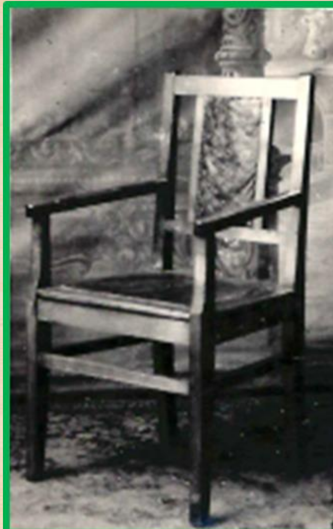
Кресло березовое с полумягким рамочным сиденьем и полумягкой спинкой

Министерство Лесной Промышленности Удмуртской АССР