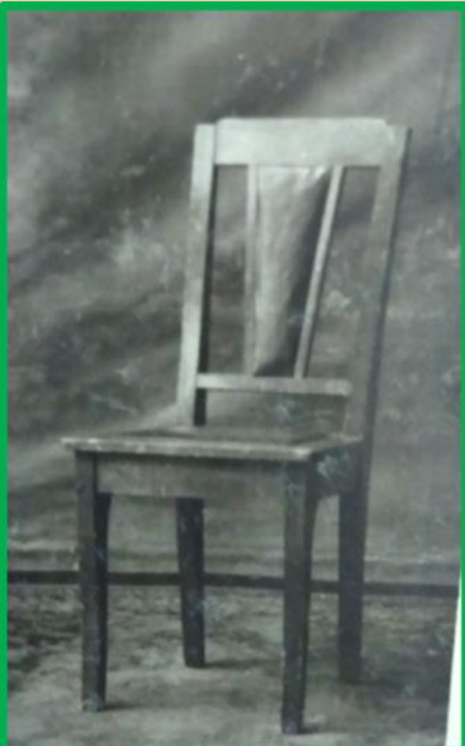
Стул хвойный с полумягким рамочным сиденьем и полумягкой спинкой