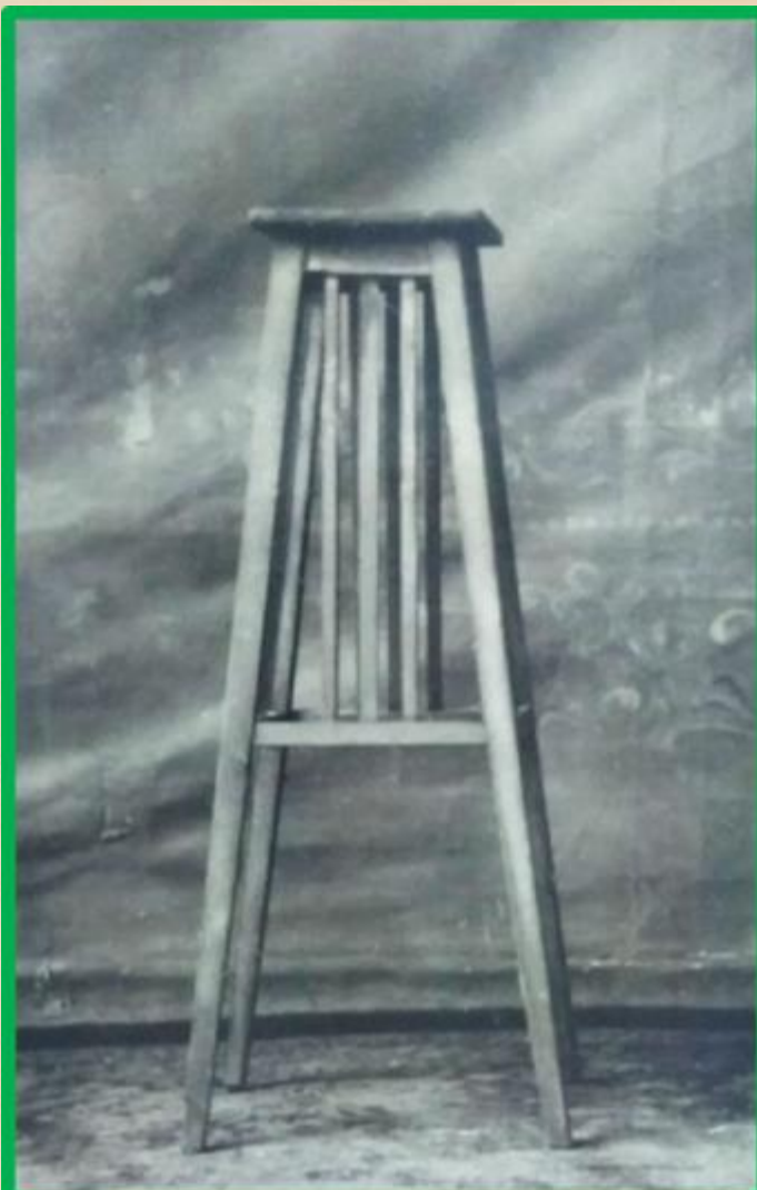
Подцветочница хвойная, с крышкой на 4 прямоугольных ножках