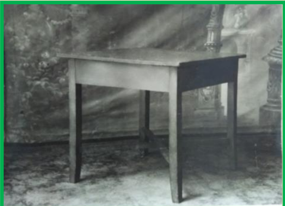
Стол обеденный не раздвижной на прямоугольных ножках с перекрестными проножками