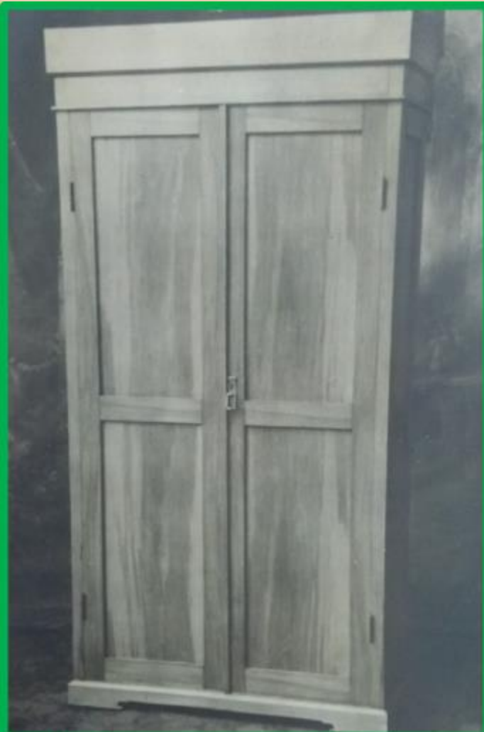
Шкаф книжный хвойный, с 2 дверками, 4 полками, неразборный, рамочной конструкции