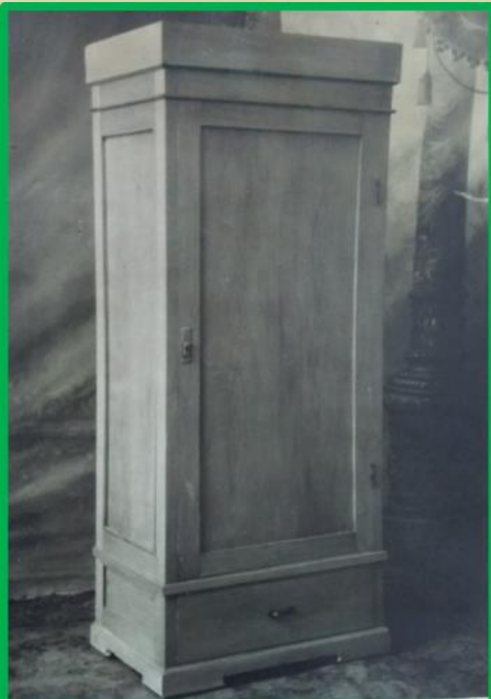
Шкаф для платья, хвойный с одной дверкой и одним наружным ящиком, неразборный, рамочной конструкции