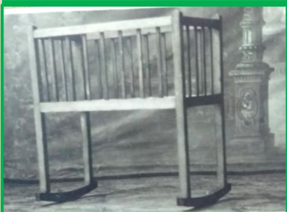
Кровать из хвойных пород, детская на высоких прямоугольных ножках с четырехсторонней решёткой