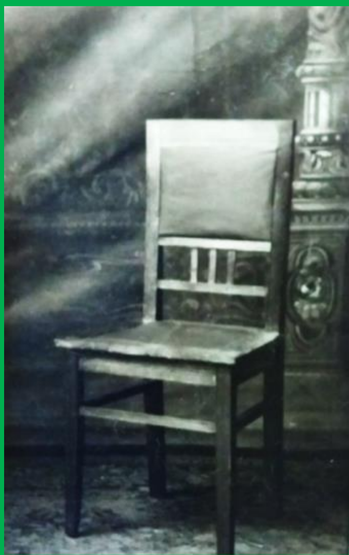
Стул березовый с полумягким рамочным сидением и полумягкой спинкой